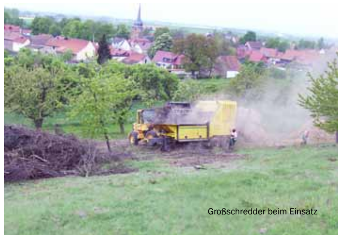
Großschredder beim Einsatz