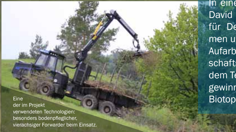
Eine der im Projekt verwendeten Technologien: besonders bodenpfleglicher, vierachsiger Forwarder beim Einsatz.

In einem Forschungsprojekt der Naturstiftung David werden auf bis zu 41 Modellflächen in für Deutschland repräsentativen Lebensräumen unterschiedliche Methoden der Ernte, der Aufarbeitung und des Transports von Landschaftspflegeholz erprobt und optimiert. Mit dem Technikeinsatz sollen die Kosten der Holzgewinnung gesenkt werden, ohne die seltenen Biotopie nachhaltig zu schädigen.