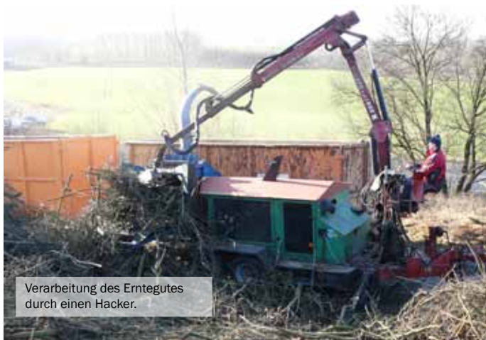
Verarbeitung des Erntegutes durch einen Hacker.

Weitere Informationen über das Verbundvorhaben „Energieholz und Biodiversität - die Nutzung von Energieholz als Ansatz zur Erhaltung und Entwicklung national bedeutsamer Lebensräume“ (03KB020) aus dem BMU-Förderprogramm „Energetische Biomassenutzung“ unter: www.energetische-biomassenutzung.de/de/projekte