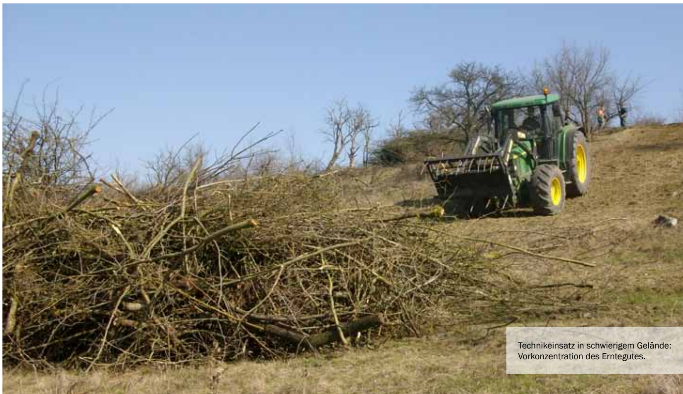
Technikeinsatz in schwierigem Gelände: Vorkonzentration des Erntegutes.